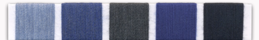
30324 Sky Blue